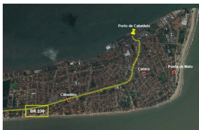
Figura 3. Acesso a rodovia BR-230.

O acesso rodoviário ao Porto de Cabedelo é realizado pela Rodovia Transamazônica - BR 230. Esta integra-se a algumas rodovias estaduais e a rodovia federal BR 101 (distante 18km do porto), permitindo por consequência, a ligação com toda malha rodoviária da Paraíba e do país. Estas BR's estão entre as principais vias de circulação de carga e de passageiros no Brasil.