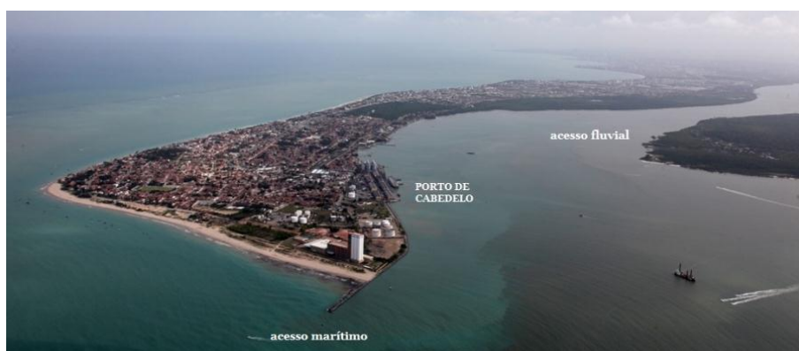
Figura 2. Vista de acesso marítimo e fluvial do Porto de Cabedelo.

O acesso marítimo é feito pela barra, na entrada do estuário do rio Paraíba do Norte, o canal de acesso, cuja largura varia entre 120m, alcançando até 200 metros por sua extensão total de 5,5 km, e profundidade de 9,14 metros. Com a atual profundidade do canal é possível atracar navios de até 220 metros de comprimento e 40 metros de boca