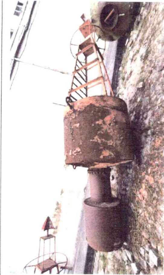
Elemento 05 - BL1