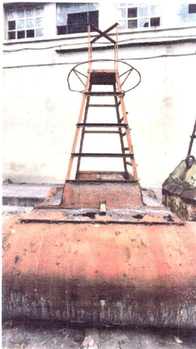
Elemento 10 - Arinque Flutuante