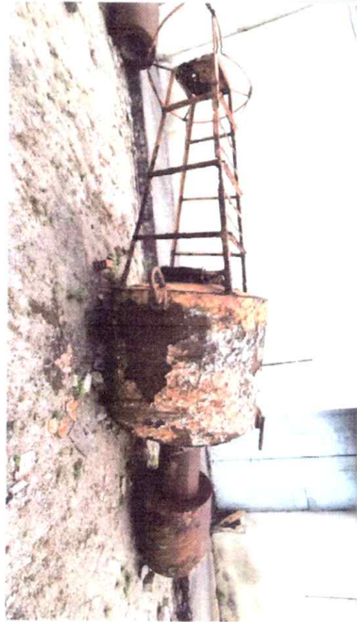
Elemento 06 - BL1