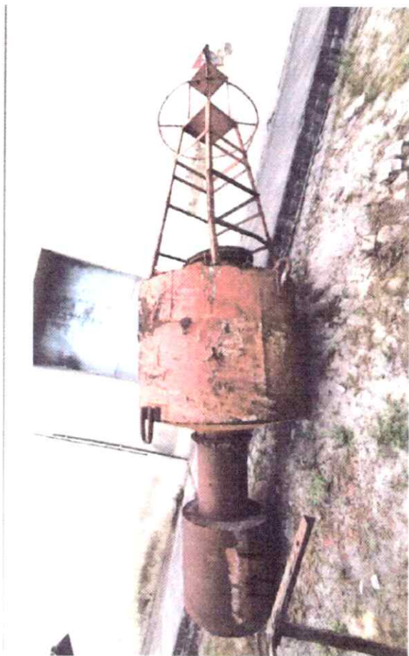
Elemento 03 - BL1