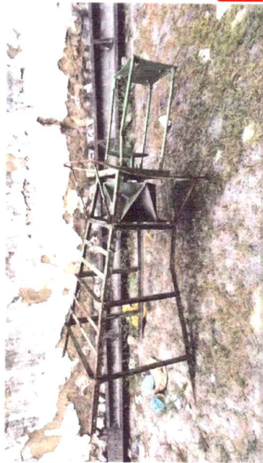
Elemento 07-B - B.L.I