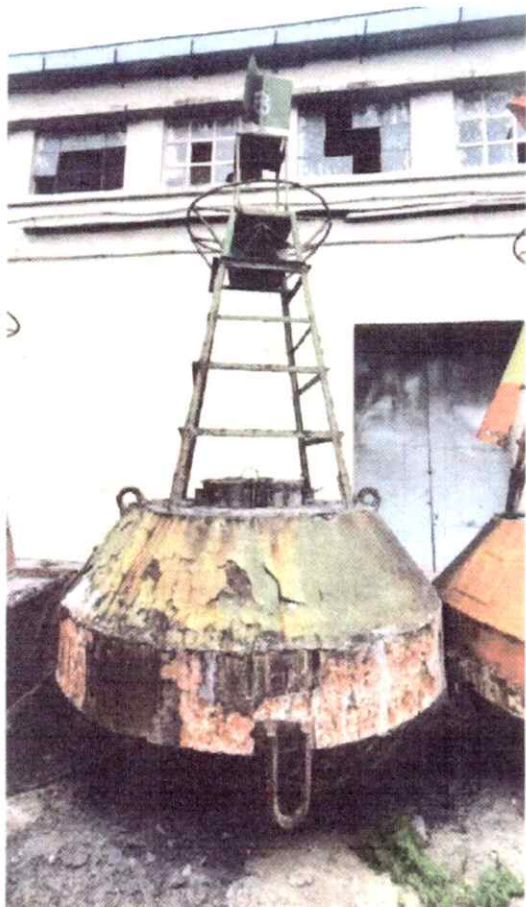
Elemento 08 – BLT