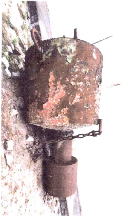
Elemento 07-A - B.L.I