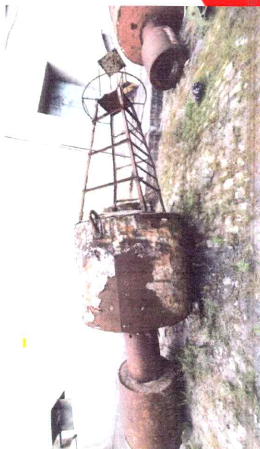
Elemento 04 - BL1